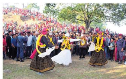
केशर रोका । प्युठान

अतिरिक्त शिक्षण अधिकाधिक विद्यार्थीको उपस्थिति 'दुव्यानाकुटी'को प्रसारका लागिमात्र नभई विद्यार्थीको शैक्षिक विकासका लागिमात्र उपयुक्त पोजको रूपमा स्वीकार गरिएको छ।