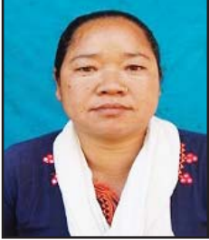
मुगा पुनमगर उपाध्यक्ष, माण्डवी गाउँपालिका

मुलुक संघीय संरचनामा गएसँगै गाउँगाउँमा स्थानीय सरकार गठन भएपछि बनेको माण्डवी गाउँपालिकामा जनतालाई न्याय दिलाउनका लागि जनप्रतिनिधिहरु दिनप्रतिदिन लागि रहेका छौं। गाउँपालिकामा उपाध्यक्षको संयोजकत्वमा न्यायिक समिति गठन भएको छ। स्थापनाको पहिलो वर्षदेखि नै न्यायिक समिति गठन गरेर हामीलाई राज्यले दिएको अधिकारभित्र रहेर न्यायिक कार्यसम्पादनलाई अघि बढाइ रहेका छौं। गाउँपालिकाबासी आम नागरीकहरुलाई अन्यायमा परेको महशुस नहुने गरी हाम्रो कार्यक्षमताले सकेसम्म जनताकै हितमा लागि रहेका छौं।