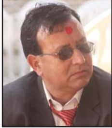
अमर तिष्ठ कृषि विकास अधिकृत, कृषि विकास शाखा